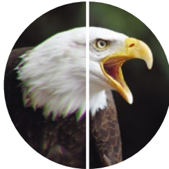
フジノン独自のマルチコート「SUPER EBC FUJINON」やEDレンズなどによる見え方の差のイメージ

全てのレンズ・プリズムへのフジノン独自のマルチコート「SUPER EBC FUJINON」をはじめ、プリズムへの位相差補正コート・誘電体多層膜コートなど、各種コーティングにより明るくコントラストに優れたクリアな見え味を実現。またEDレンズ採用により色収差を効果的に補正しています。他に、広視野ながら中心部から周辺部までシャープで歪曲収差が少ないことや、可視光がバランスよく透過するため余計な味付けがない肉眼に近い自然な見え方も特長です。